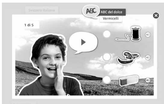
Die verschiedenen Aufgaben werden vor allem mittels Hörverständnis gelöst.