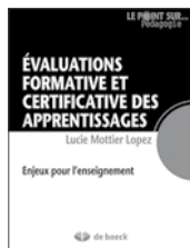
Mottier Lopez, L. (2015). Evaluations formative et certificative des apprentissages. Enjeux pour l'enseignement . Bruxelles: De Boeck, 112 pages.

Cet ouvrage ne porte pas spécifiquement sur l'évaluation dans l'enseignement des langues; il pourra cependant intéresser les lecteurs cherchant à faire le point sur les concepts auxquels on se réfère dans le champ de l'évaluation en milieu éducatif et sur les questions vives qui s'y posent. Paru dans la collection «Le point sur... Pédagogie», il s'adresse à des étudiants, enseignants et formateurs d'enseignants. Le propos est ciblé sur les synergies possibles entre les fonctions formative et certificative de l'évaluation des apprentissages et sur les principaux enjeux de cette évaluation envisagée comme moyen d'enseignement pour l'enseignant et d'apprentissage pour l'élève. Lucie Mottier Lopez propose tout d'abord un aperçu de l'émergence du domaine de l'évaluation des apprentissages des élèves et de la problématique évaluative