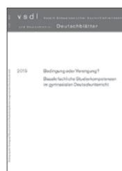
Bedingung oder Verengung? Basale fachliche Studierkompetenzen im gymnasialen Unterricht, Deutschblätter , 2015 – www.vsd.ch

unités d'évaluation centrales de la base de données en cours d'élaboration – et des matériaux langagiers (textes, corpus...) utilisés pour l'évaluation du français. L'accent est mis en particulier sur les items mesurant la compréhension. Les auteurs s'appuient sur un examen des outils de mesure existants dans le but de parvenir à un outil d'analyse opératoire et aussi simple que possible. Celui-ci devrait ainsi être à même de guider les enseignants et les concepteurs d'épreuves dans l'élaboration ou le choix d'items et de textes pour l'évaluation de la compréhension.