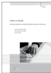
Sánchez Abchi, V., de Pietro, J.-F. & Roth, M. (2016). Evaluer en français: comment prendre en compte la difficulté des items et des textes . Neuchâtel: IRDP. (Document de travail 16.1001).

en Sciences de l'éducation tout au long du 20 e siècle. Dans cette partie comme dans le reste de l'ouvrage, elle porte un regard sur les travaux issus des communautés scientifiques tant francophones qu'anglophones. C'est ensuite aux principaux modèles et concepts qui structurent le domaine qu'elle s'intéresse, tout en se penchant également sur des éléments méthodologiques. Enfin, le 3 e chapitre présente quelques axes actuels de recherche sur les pratiques évaluatives en classe. Tout au long de l'ouvrage, des encarts proposant des extraits de textes d'auteurs étayent le propos. Le bilan des travaux majeurs pour ce champ offre au lecteur la possibilité de clarifier les fondements théoriques nécessaires pour aborder la problématique évaluative et penser les pratiques d'évaluation.