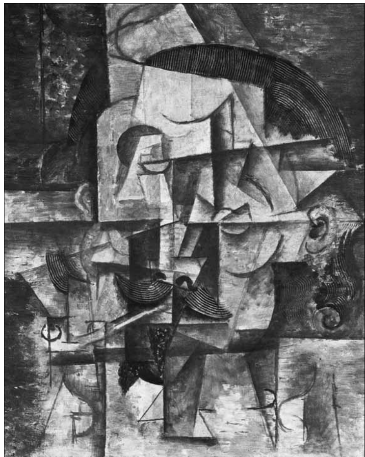
Pablo Picasso, Le poète, 1912.

Conformément à l'idée que le développement d'un répertoire pluri-lingue «comprend aussi le développement d'une conscience d'autres cultures et groupes culturels» (Beacco & Byram, 2007, 37), le Lehrplan 21 ajoute aux apprentissages langagiers des apprentissages liés à des contenus culturels et promeut des compétences de décentration et de distanciation. Pour les L3, le domaine Kulturen in Fokus définit des objectifs répartis en Kenntnisse , Haltungen et Handlungen , qui rappellent