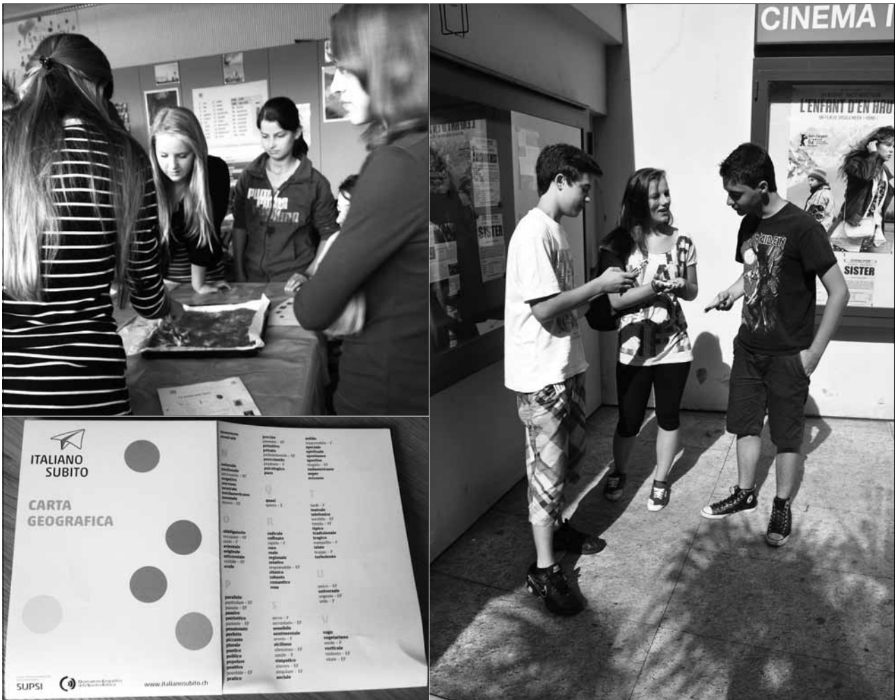
La raccolta delle “parole gratis” sotto forma di “carta geografica” sono uno strumento di orientamento pieghevole sempre consultabile nelle diverse situazioni comunicative.