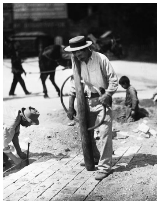
Eugène Atget, Paveur de rues, Paris, 1899.

Intento a spiegare ai giocatori la differenza tra prestazione ( leistung ) ed il fatto di vincere ( siegen ), l'allenatore risulta esitare ( wir sch-aber besser... ) proprio nel momento di formulare un aspetto centrale del suo proposito (la prestazione come imperativo per la vittoria). La riformulazione di tale aspetto in francese gli permette di lisciare l'espressione, renderla più fluida ed affinarne il senso. In altri casi, l'alternanza di codice interviene come espediente comunicativo volto ad aggirare il probabile esolinguisimo di una parte dei giocatori.