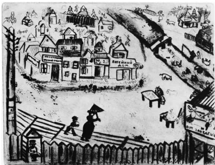
Nikolaj Vasil'evič Gogol', Le Anime morte , illustrazione di Marc Chagall.