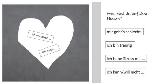
Abbildung 2: PPT/Handout zur Visualisierung und Formulierung von Gemütszuständen.

Wörterverzeichnis: stehen, heben, biegen, stellen, strecken, fassen, atmen, vorn/hinten, links/rechts, oben/unten Anleitung: Beschreibungen von einer Rei-