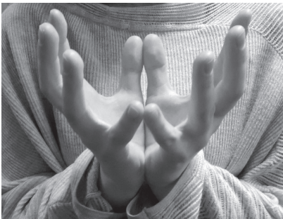
Abbildung 1: Schülerin formt ihre Hände zu Lotus mudra im deutschen Sprachlager in Estes Park, CO. Feb. 2019.

Weiterführung: Die Lotus Mudra ist eine symbolische Handgeste, die sowohl Kommunikation durch die bis an die Kehle reichenden Finger verdeutlicht, als auch das Herz mit der energetischen Bewegung öffnet. Auf die Atem- und