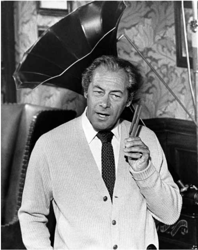
Una scena dal film "My Fair Lady".

Un extrait filmé montre aussi l'enseignante au travail avec une étudiante anglophone qui avait beaucoup de difficultés pendant ce cours, à commencer par la compréhension de la scène du dvd. Or, si le sens s'éclaire avec la transcription, d'autres problèmes surviennent, car notre étudiante se base sur l'écrit, ce qui va fausser le découpage syllabique. Dans le film, on lui fait répéter: «tu parl(es) tout l(e) temps d(e) ton père». Vu le nombre de «e» muet qui tombent, cette réplique présente une difficulté particulière, car l'étudiante doit prononcer six syllabes 16 et non pas huit 17 , comme elle aurait tendance à le faire; mais l'enseignante lui répète l'énoncé en frappant le rythme, invitant l'étudiante à le répéter de même, et elle finit par laisser tomber les «e» muets pour produire le son /t/ ainsi que /dt/. Ce deuxième groupe consonantique est plus difficile à produire, car le /d/ passe quasiment inaperçu chez un locuteur francophone étant presque assimilé au /t/ qui suit. Lorsque /d/ et /t/ sont prononcés séparément, la langue doit se détacher de son point d'articulation qui est pourtant minime. A cela s'ajoute le fait qu'en anglais, ces consonnes sont plosives. Plutôt que des explications théoriques laborieuses, la prise de conscience et la remédiation se font en situation pendant le dialogue.