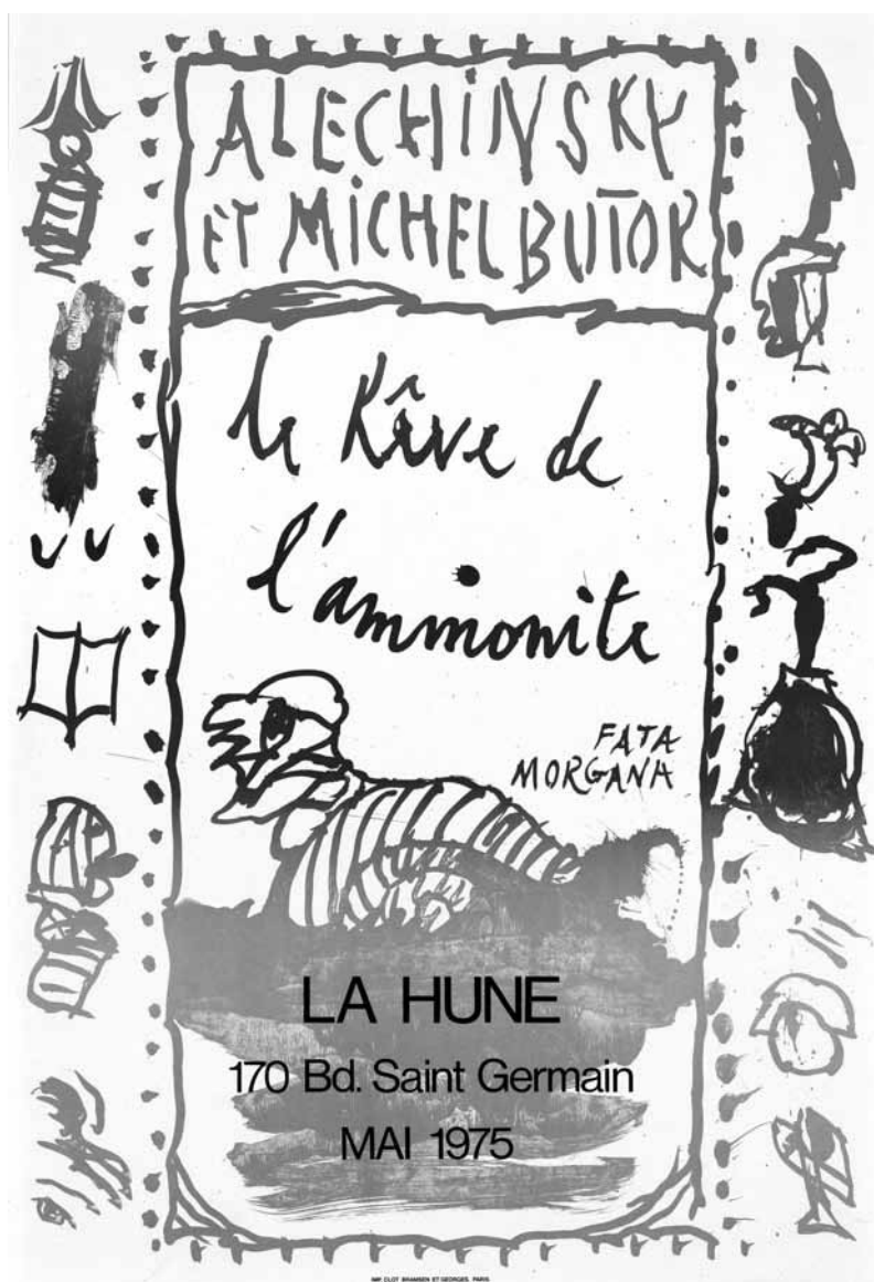
Pierre Alechinski et Michel Butor, Le Rêve de l'ammonite , 1975.

Ce modèle s'est formé dans les cantons le long de la frontière des langues, ce qui n'est pas surprenant. Il est maintenant évident que les expériences faites seront prises en compte dans le développement des plans d'études régionaux, notamment le plan d'études 21 (Lehrplan 21).