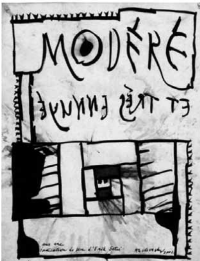
Pierre Alechinsky, Sur des indications de jeu d'Erik Satie, 2002.