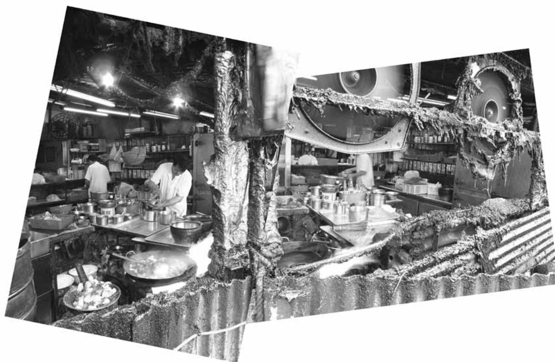
Japanese BBQ.

est titulaire d'un Phd de l'Université de Pennsylvanie ainsi que d'une maîtrise de l'Université de Paris IV - Sorbonne et enseigne à Rutgers University (USA). Ses principaux domaines de recherche, d'enseignement et de publications englobent la langue, la littérature et la civilisation du Moyen-Âge tardif en France et dans la péninsule ibérique, la mythographie, l'histoire du goût, l'historiographie du livre ainsi que des traductions.