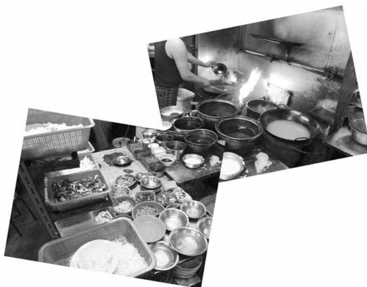
Complete Flash Fry.

En outre, l'autoévaluation régulière revêt un rôle important car elle permet à chaque élève de prendre conscience de ce qu'il sait, de ce qu'il sait faire en fonction des tâches à réaliser et des aspects qui sont à améliorer.