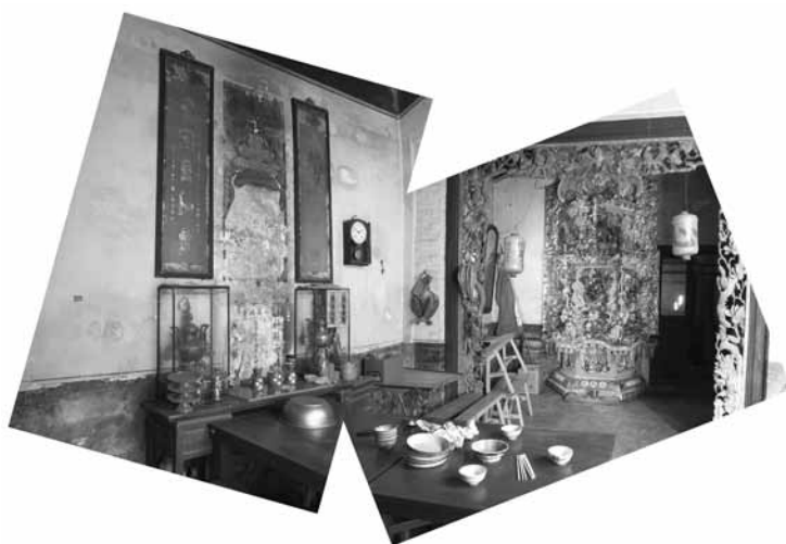
Old Pickling Crock.

3. Seit dem 1. Januar 2013 gibt es in der Schweiz den Beruf Systemgastronomiefachfrau EFZ/Systemgastronomiefachmann EFZ . Das erste Qualifikationsverfahren auf nationaler Ebene findet 2016 statt. Bei diesem neuen und jüngsten Beruf im Feld der gastgewerblichen Grundbildungen wurde ein eigener Handlungskompetenzbereich Fremdsprache geschaffen. Seit rund zwei Jahren wird in diesem Beruf (im Gefäss der Berufskunde) in allen Sprachregionen Englisch „gebüffelt“. Die ersten Erfahrungen zeigen beträchtliche Niveauunterschiede, was mit Einstufungstests zu Beginn der Ausbildung belegt werden kann. Obwohl der Englischunterricht mit Bildungsinhalten aus der Systemgastronomie verknüpft ist, wird er im Un-