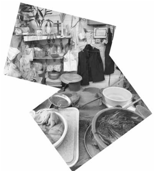
Blanched Seasonal Vegetables.

PhD, ist Mitglied der Redaktion von Babylonia. Seit Jahren ist er in der Lehrerausbildung tätig und beschäftigt sich mit Fragen der Didaktik und der Schulinnovation.