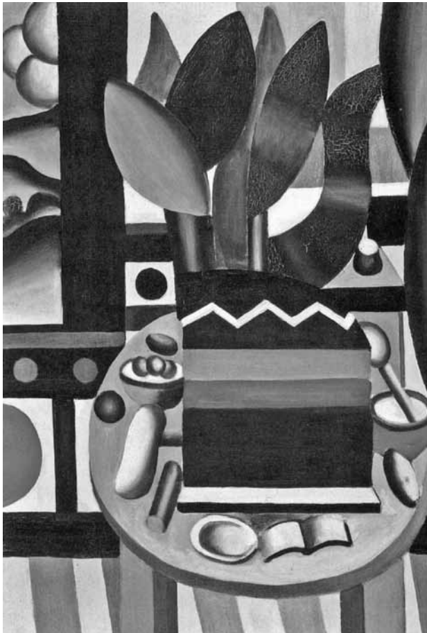
Fernand Léger, Nature morte , 1922.

Michel Arouimi est maître de conférences en littérature comparée à l'Université du Littoral de Dunkerque. Ses recherches, illustrées par plus de cent articles et une dizaine d'ouvrages, concernent la remise en cause de l'Harmonie dans les œuvres d'écrivains de diverses époques. Les réminiscences de l'Apocalypse dans la culture contemporaine et dans la littérature sont l'objet de ses ouvrages L'Apocalypse sur scène (2002) et Les Apocalypses secrètes (2007). Michel Arouimi s'est intéressé à l'œuvre picturale et littéraire de Carlo Levi ( Magies de Levi , 2006). Rimbaud est le fanal de cette recherche, comme en témoignent ses récents ouvrages Vivre Rimbaud selon Ramuz et Bosco (2010), Jünger et ses dieux (2011), ou encore Rimbaud malgré l'autre (2014). La profondeur méconnue des chansons de Françoise Hardy a également retenu son attention ( Françoise Hardy: pour un public majeur , 2012). Michel Arouimi est aussi poète. Quelques revues littéraires françaises ou étrangères ont accueilli certains de ses poèmes. Ses deux recueils publiés rassemblent des textes de diverses époques: Effets de serre (2009), Paris: L'Harmattan, ou encore Paysages sous tension (2012), Lyon: Jacques André.