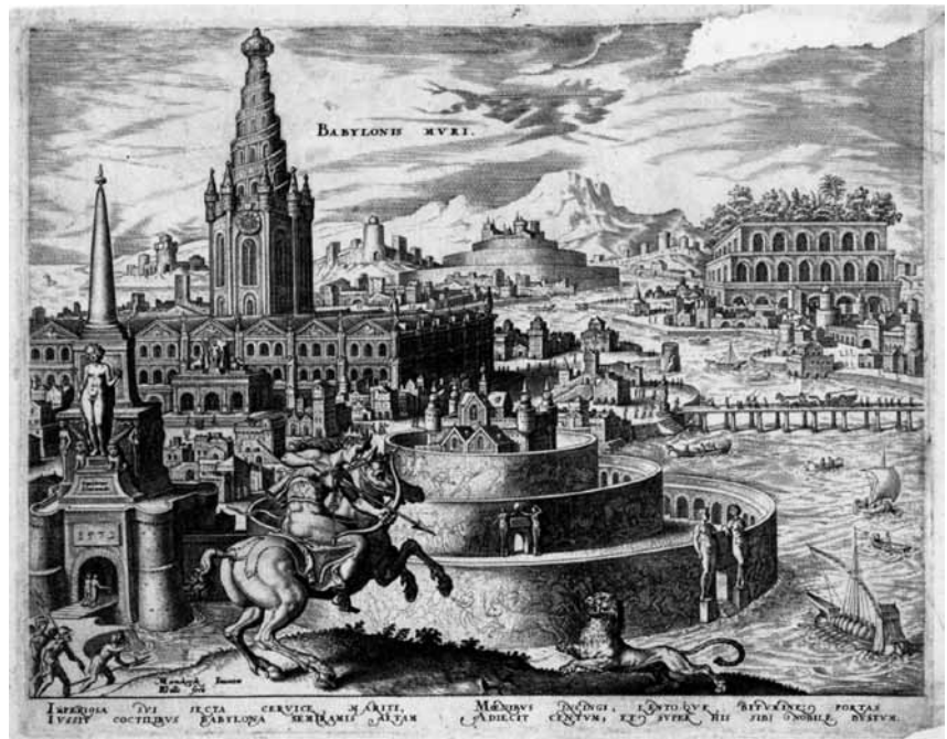
Maarten van Heemskerck, Babylonis muri, 1572.

récoltées sur la base d'hypothèses assez frustes, voire d'une vision un peu impressionniste du rôle des langues dans l'activité économique. Par ailleurs, certaines enquêtes fréquemment citées (telles que l'enquête ELAN, financée par la Commission européenne) souffrent de sérieuses failles méthodologiques.