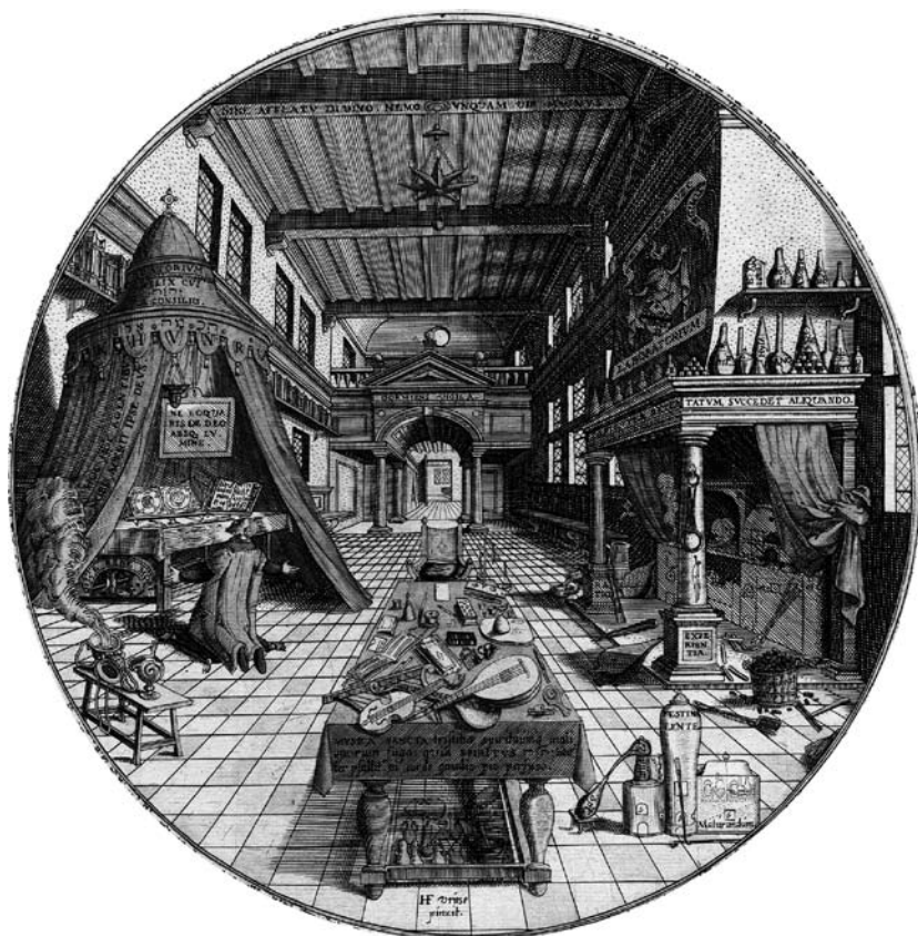
Heinrich Khunrath (1595), Amphitheatrum sapientiae aeternae (Laboratorio dell'alchimista) .

4 Das quasi-experimentelle Forschungsdesign ergibt sich dadurch, dass die Kantone Obwalden, Zug und Schwyz das Modell 3/5 früher