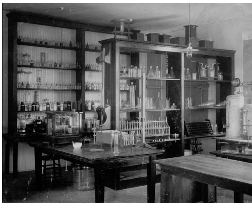
Laboratorio chimico dell'inizio del '900.

On entend souvent dire que l'enseignement bilingue est libérateur, car la norme linguistique se cache à l'arrière-plan d'une priorité communicative bénéfique pour l'apprentissage. Ceci se vérifie du point de vue des attentes strictement communicatives, où il s'agit d'encourager les apprenants à recourir à des stratégies leur permettant de communiquer malgré des moyens limités en L2. L'approximation linguistique contribue ainsi à établir les conditions requises pour le fonctionnement de l'échange verbal (savoirs obligatoires voire compatibles). Toutefois, du point de vue de la discipline, la négociation de certains savoirs linguistiques, en particulier les savoirs inscrits (savoirs linguistiques indispensables à la conceptualisation et non tellement à la communication dans la discipline), devra obéir à des exigences précises. Dans la séquence