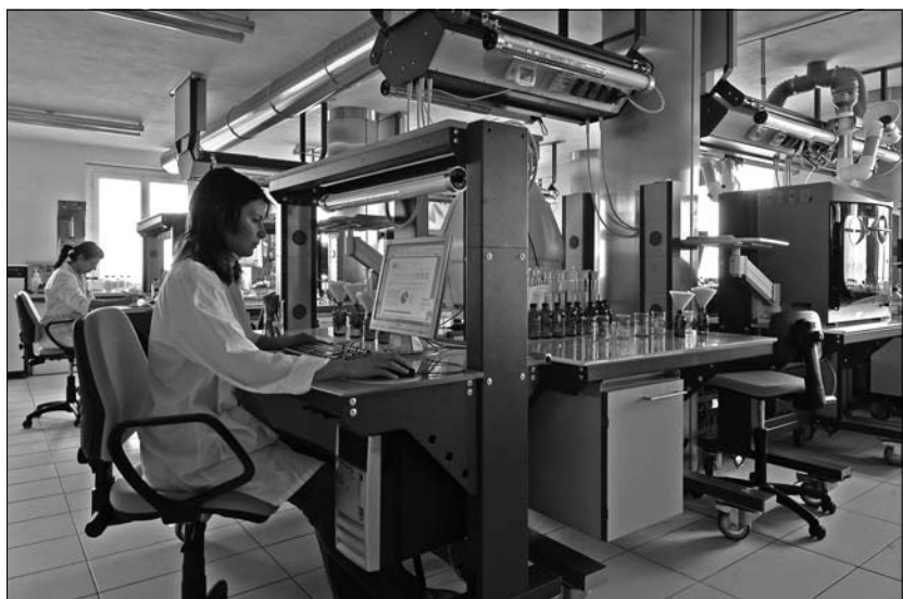
Laboratorio chimico moderno.

Da im immersiv unterrichteten Sachfachunterricht dieselben Lernziele wie im einsprachigen Unterricht erreicht werden sollen, versuchen die Lehrpersonen, den Stoff auf möglichst unterschiedliche Weise zu