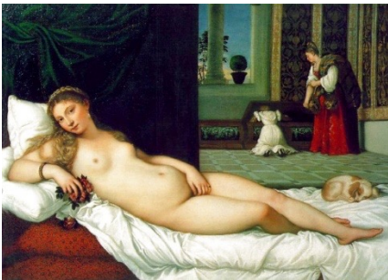
La Venere di Urbino, Tiziano