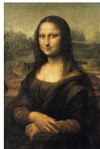
Monna Lisa, Leonardo da Vinci