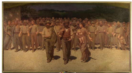
Il Quarto Stato, Pellizza da Volpedo

N.B. Tutte le immagini usate nella scheda sono libere da diritti (Public domain, via Wikimedia Commons)