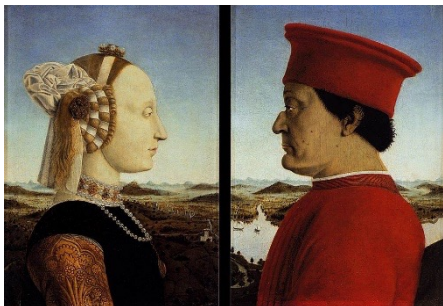
Doppio ritratto dei duchi di Urbino, Piero della Francesca