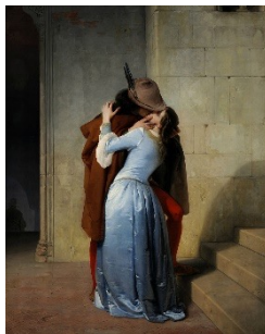
Il bacio, Francesco Hayez