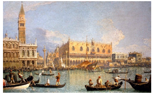
Veduta del palazzo ducale, Canaletto