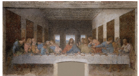
L'ultima cena, Leonardo da Vinci