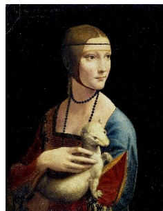
La dama con l'ermellino, Leonardo da Vinci