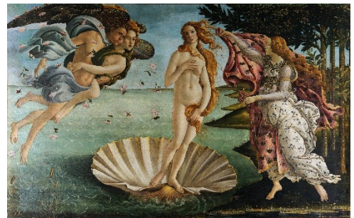
La nascita di Venere, Sandro Botticelli