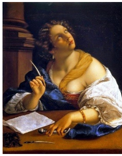
Allegoria della retorica, Artemisia Gentileschi