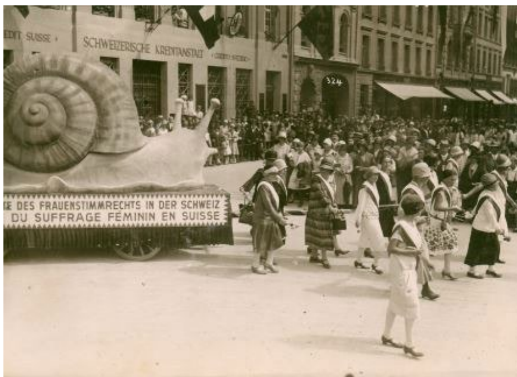
En 1928, le suffrage féminin arrive à la vitesse de l'escargot.