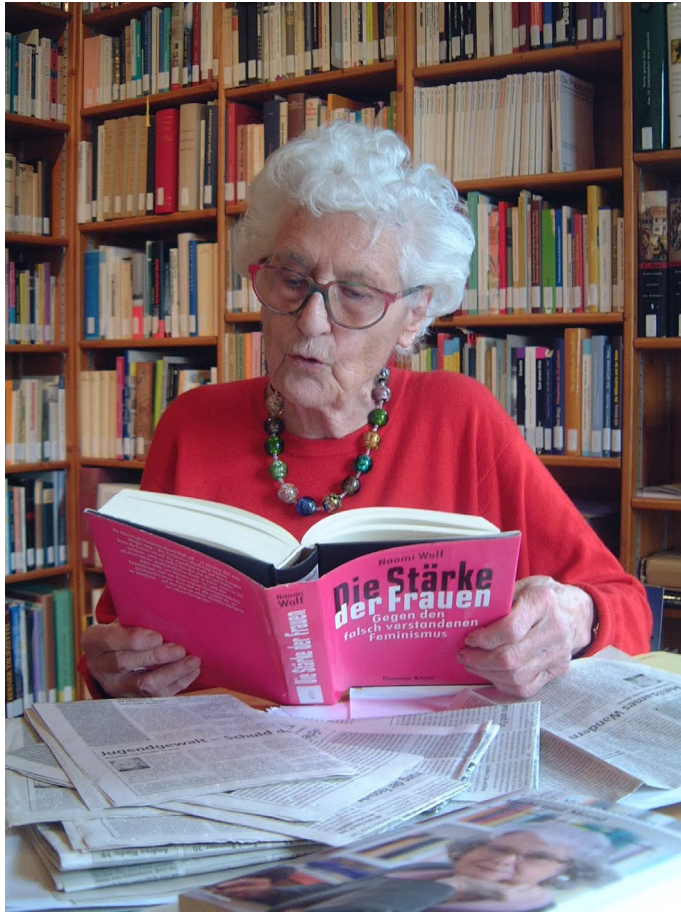
Marthe Gosteli, vers 2000, Fondation Gosteli, AGoF, Fotosammlung n.k., Publiée avec l'aimable autorisation de la Fondation Marthe Gosteli