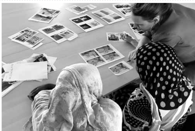
Réalisation du portrait d’Istahil par Hodan