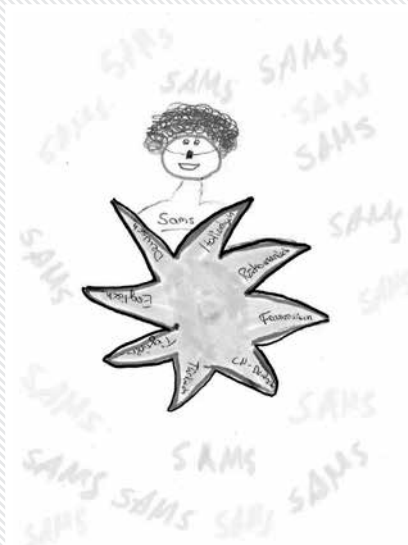
Bilder der Schülerinnen und Schüler aus dem Schulhaus Fraumatt in Liestal zum SAMS-Tag 2016.