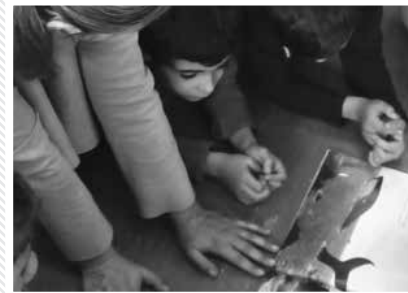
Workshops am SAMS-Tag 2016, von angehenden Lehrpersonen der PH FHNW gestaltet und durchgeführt.