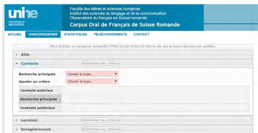
Figure 1: Fonction « Recherche » du concordancier.

Un tutoriel succinct se trouve dans la rubrique et un mode d'emploi plus fourni est intégré au document de référence téléchargeable sur le site, qui contient également des informations sur les modalités de transcription et sur les données recueillies à propos des locuteurs (par ex. âge, sexe, etc.). Comme expliqué dans le tutoriel, il est possible de procéder à des recherches plus complexes par le biais de filtres 6 .