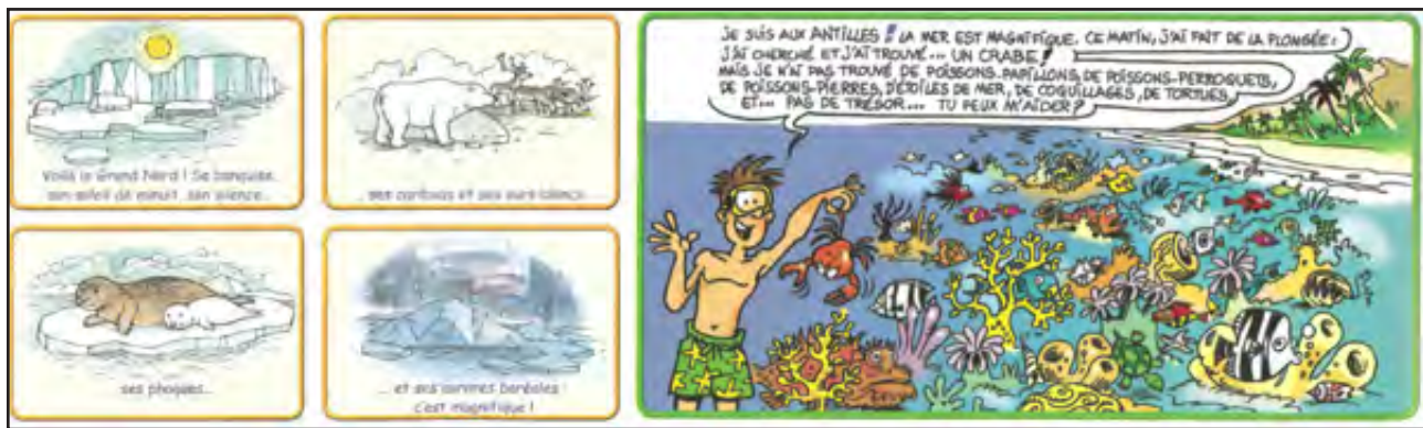
Esempi di rappresentazioni "esotiche" del Canada (p. 32) e delle Antille (p. 44) nel manuale Alex et Zoé 3 .